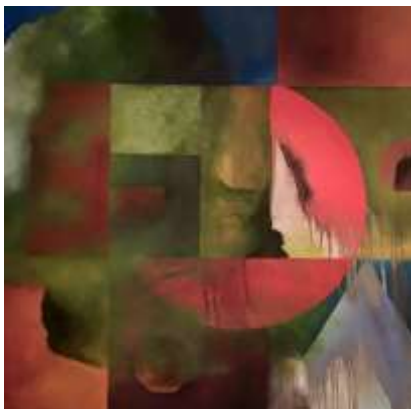
Angélica Gatica G. Pensando, Óleo / Tela 120 x 150 cm., 2010